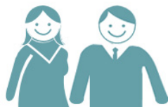
Personas mayores de 15 años