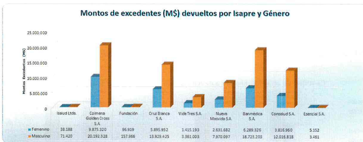
Gráfica N°2: Montos de excedentes afectos a devolución por Isapre y Género.