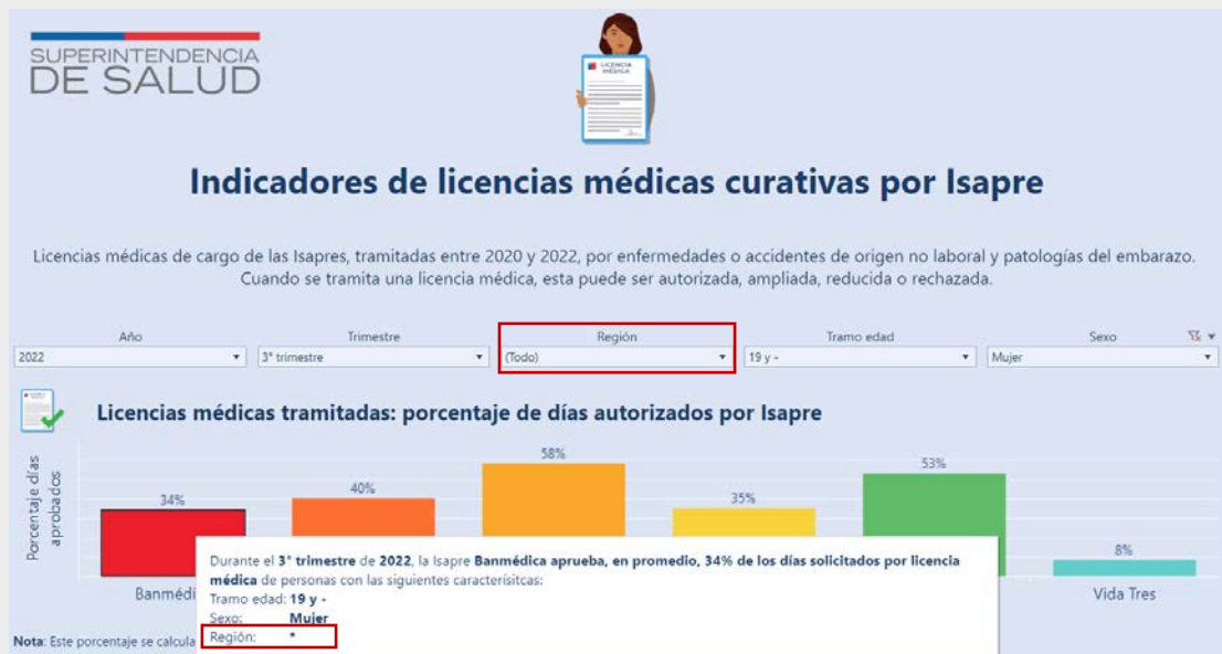
Imagen 1: Ejemplo uso de filtros en la plataforma.

Fuente: http://www.supersalud.gob.cl/difusion/665/w3-propertyvalue-7410.html